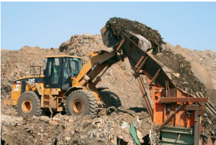
Deponierückbau gibt der Umwelt wertvolle Flächen zurück!