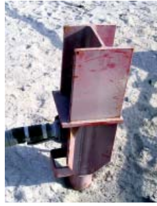
Biofilteranlage zur Belüftung der Deponiefelder und einzelner Lanzenkopf

Biofilter facilities for aeration of the landfill areas and connection to lance cap.