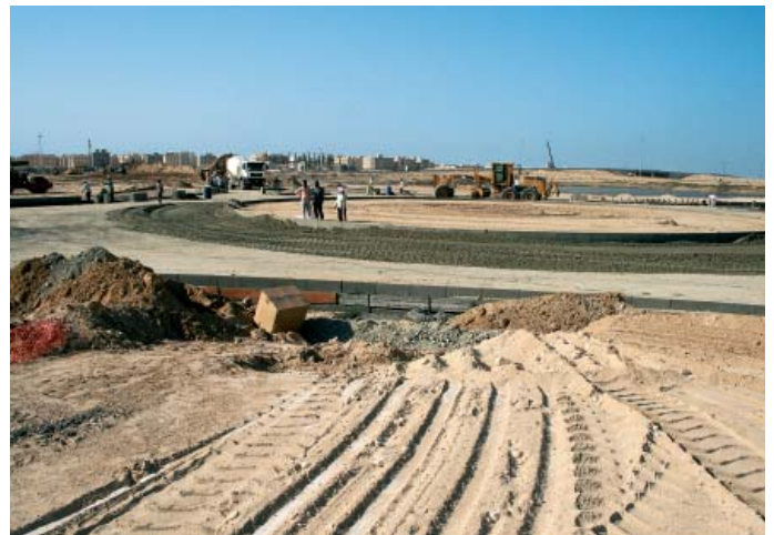
Landfill remediation reclaims valuable space!

Im Zuge des Deponierückbaus treten folgende PROBLEMSTELLUNGEN auf: